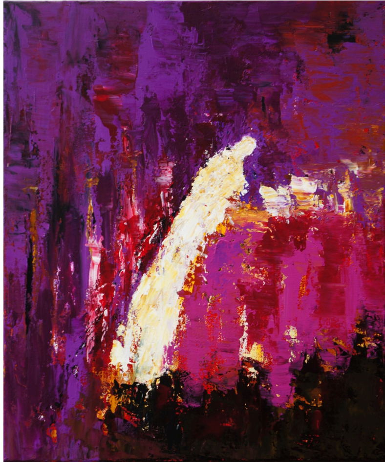
Afbeelding: Heleen de Lange, Kruisweg 'Schouwen' - Kruis

Wilt u zoveel als mogelijk - in stilte - vooraan in de kerk plaatsnemen?